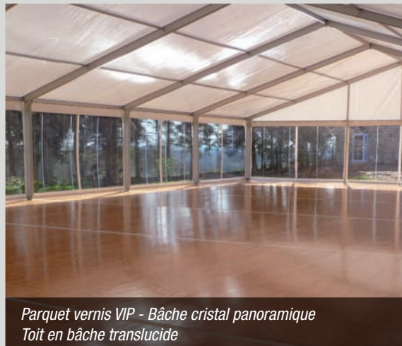
Parquet vernis VIP - Bâche cristal panoramique Toit en bâche translucide