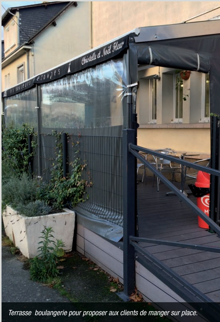
Terrasse boulangerie pour proposer aux clients de manger sur place.