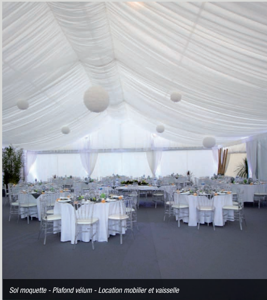
Sol moquette - Plafond vélum - Location mobilier et vaisselle