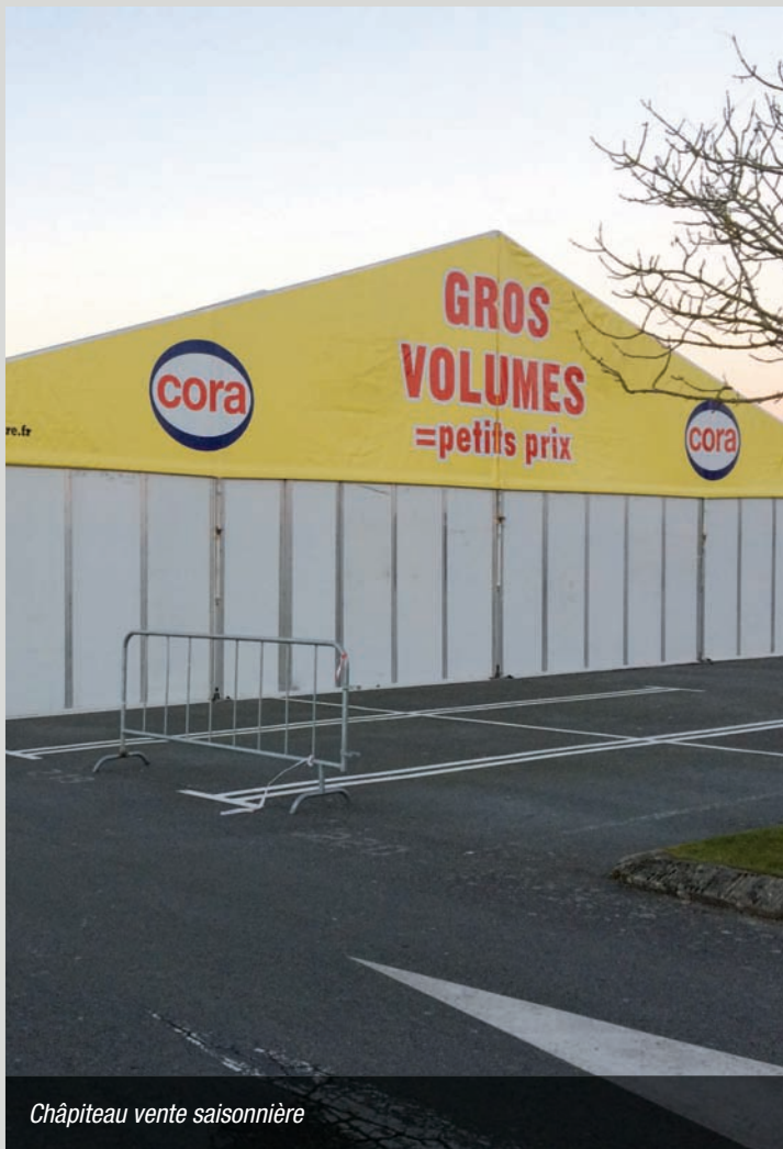
Châpiteau vente saisonnière