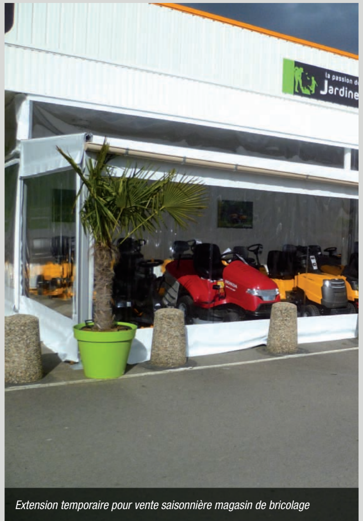
Extension temporaire pour vente saisonnière magasin de bricolage