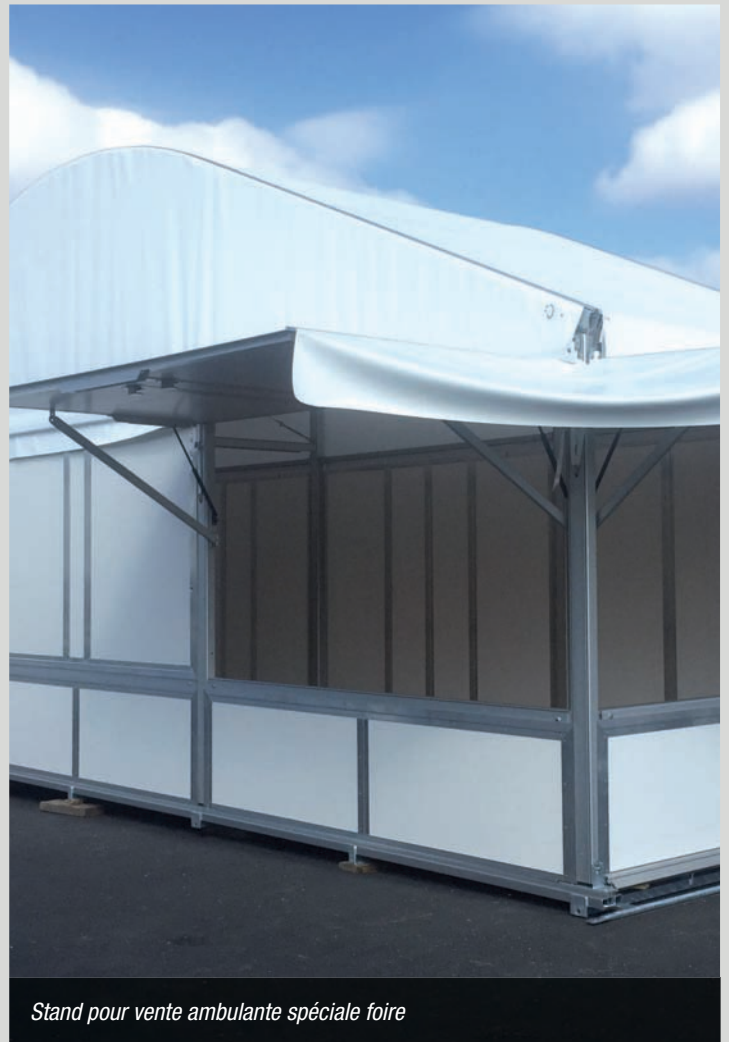
Stand pour vente ambulante spéciale foire