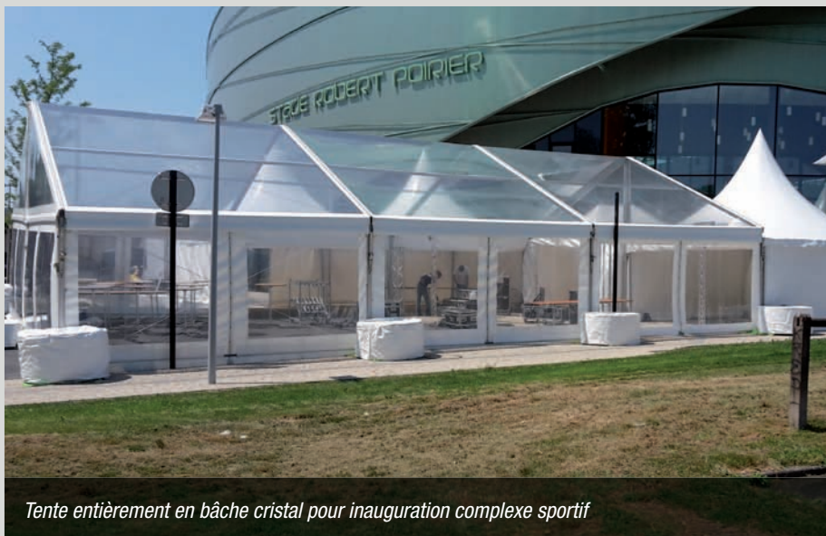
Tente entièrement en bâche cristal pour inauguration complexe sportif