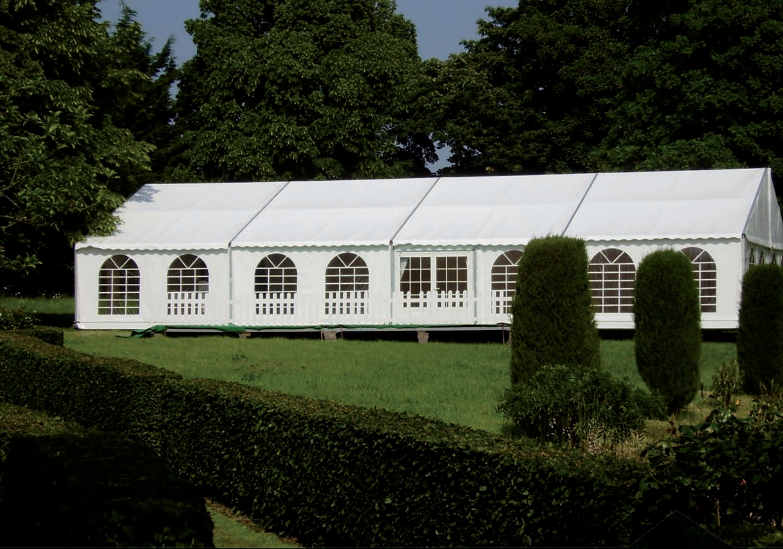
TENTE DE RÉCEPTION - 15 X 3 MÈTRES - Capacité d'accueil 150 personnes