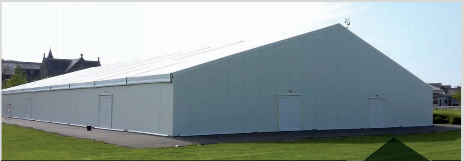
TENTE DE RÉCEPTION - 20 X 40 MÈTRES - Capacité d'accueil 1 500 personnes